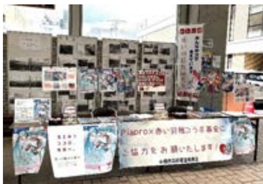
【小樽アニメパーティー 共同募金ブース】